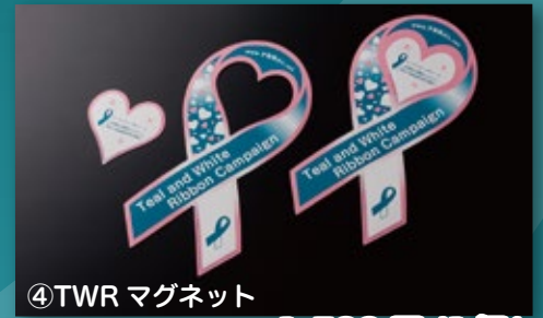
④TWR マグネット 200×100mm 1,500円(1個)