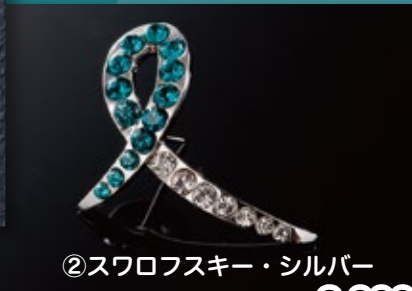
②スワロフスキー・シルバー 20×23mm 2,000円