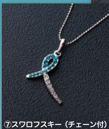
⑦スワロフスキー (チェーン付) チャーム 20×20mm チェーン 40cm 2,000円