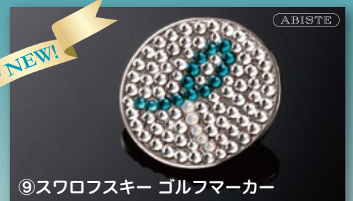
⑨スワロフスキー ゴルフマーカー 25×25mm 2,500円