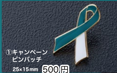
①キャンペーン ピンバッジ 25×15mm 500円