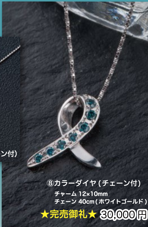
⑧カラーダイヤ (チェーン付) チャーム 12×10mm チェーン 40cm (ホワイトゴールド) ★完売御礼★ 30,000円