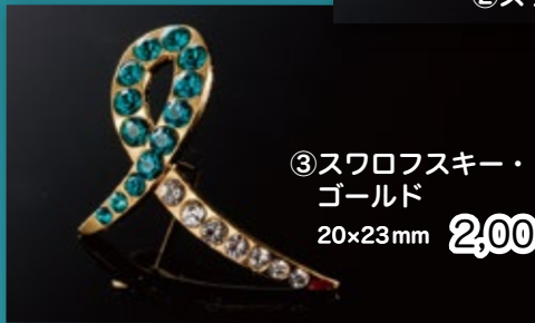
③スワロフスキー・ ゴールド 20×23mm 2,000円