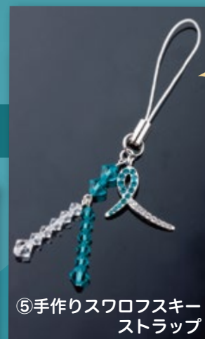
⑤手作りスワロフスキー ストラップ 60×22mm 2,000円